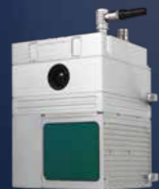
100C机载三维激光扫描仪

南方全新一代航测利器SF600ProC,由智航SF600全新升级,结合100C三维激光扫描测量系统,测程450米,扫描速率72万点/秒,配备高效能智能锂电池系统使其负载作业时长高达45分钟,搭配LidarStar专业软件,提供高精度点云采集、预处理、解算、平差、浏览等全流程解决方案。